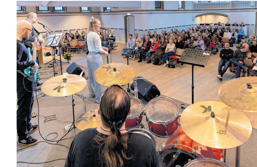
De Top2000-kerkdienst in Meppel had een liveband die de nummers vertolkte.

De toen 17-jarige knaap haalt het meest bepalende moment metelooos terug. „Ik